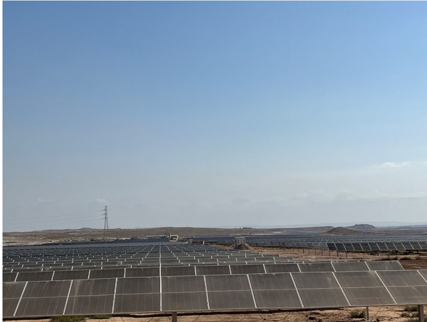
Figura 3 Montaje de los módulos fotovoltaicos