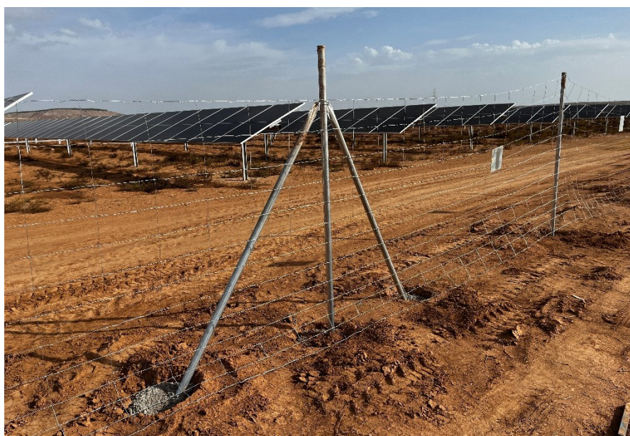
Figura 7 Instalación del vallado perimetral