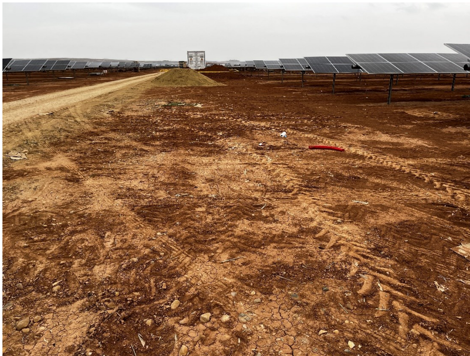
Figura 9 Restos de plásticos