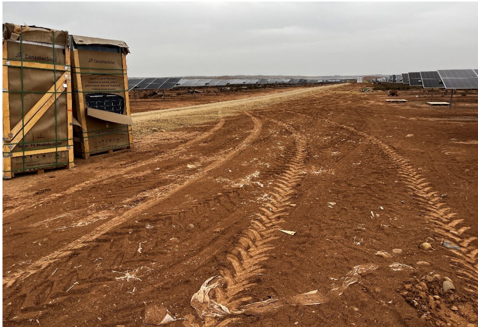
Figura 8 Restos de plásticos