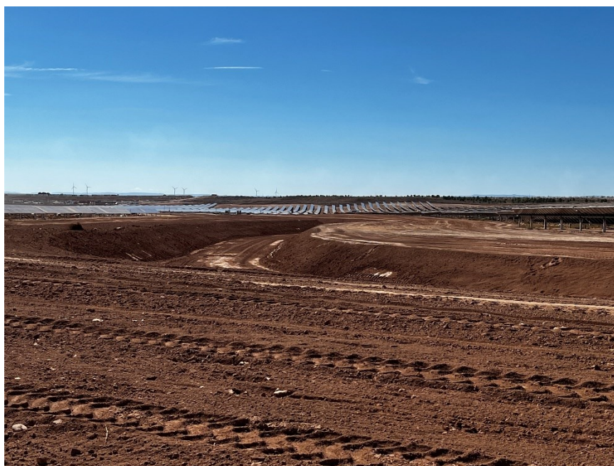
Figura 2 Red de drenajes

Se ha cimentado diferentes puntos del vial interno con mayor probabilidad erosiva, y se ha continuado con la red de drenaje.