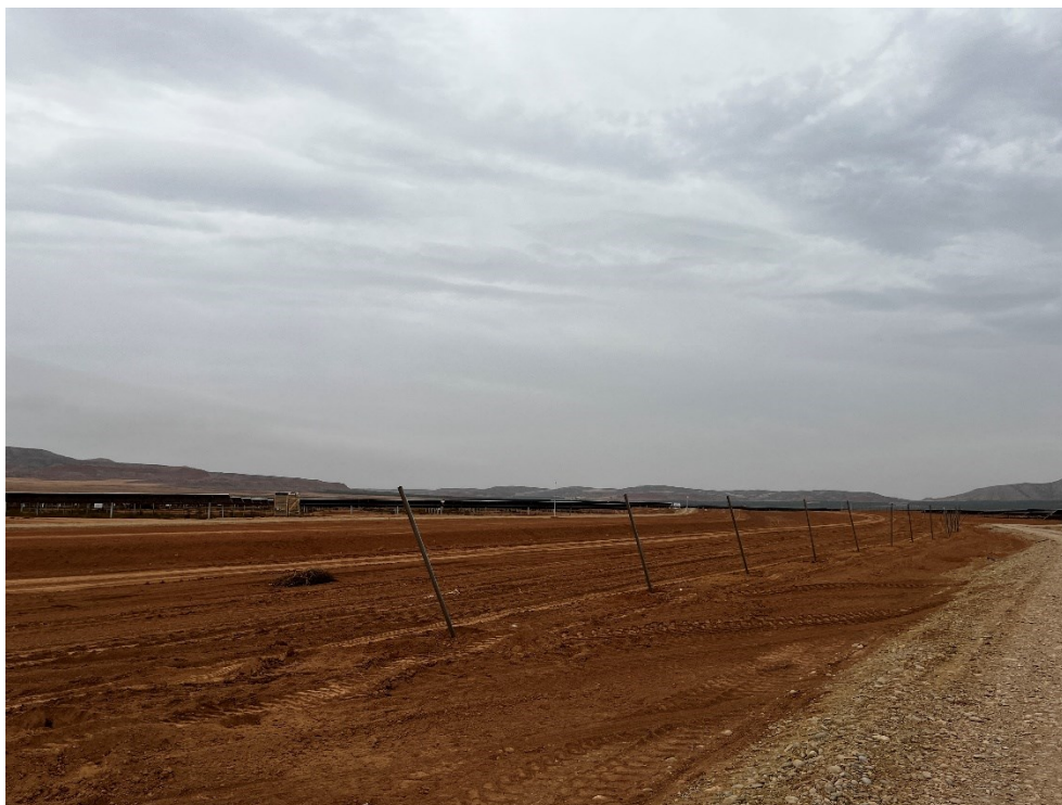
Figura 10 Colocación del vallado perimetral