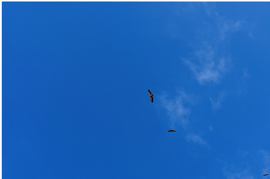
Figura 6 Grupo de buitres leonados (Gyps fulvus)

El presente anexo se compone de un número representativo de fotografías del total realizado durante el periodo evaluado, escogidas por su relevancia y/o carácter explicativo para la correcta comprensión del presente informe.