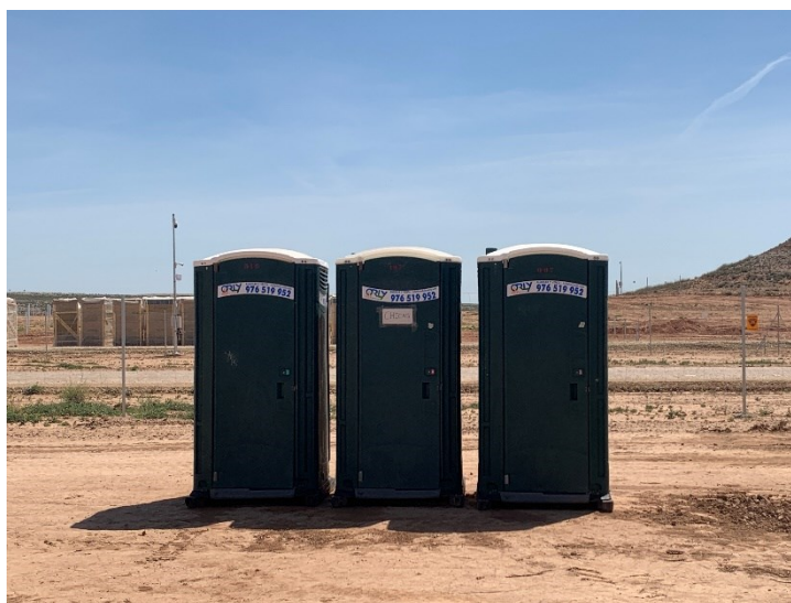
Figura 4 Baños químicos

La ejecución de los trabajos no afecta a cauces ni cursos de agua, tanto temporales como permanentes y la gestión de aguas residuales (baños químicos) se realiza correctamente.