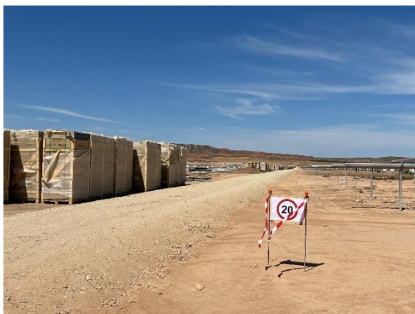
Figura 5 Señalización en obra

La obra dispone de cuba de agua y se realizan riesgos con regularidad. Además, la obra cuenta con un límite de velocidad establecido de 20km/h para reducir de esta forma las emisiones de polvo.